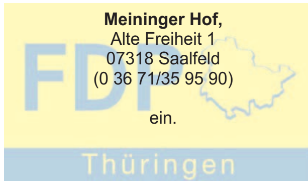
Uwe Barth, MdL Landesvorsitzender

Samstag, 15. September und Sonntag 16. September nach Saalfeld